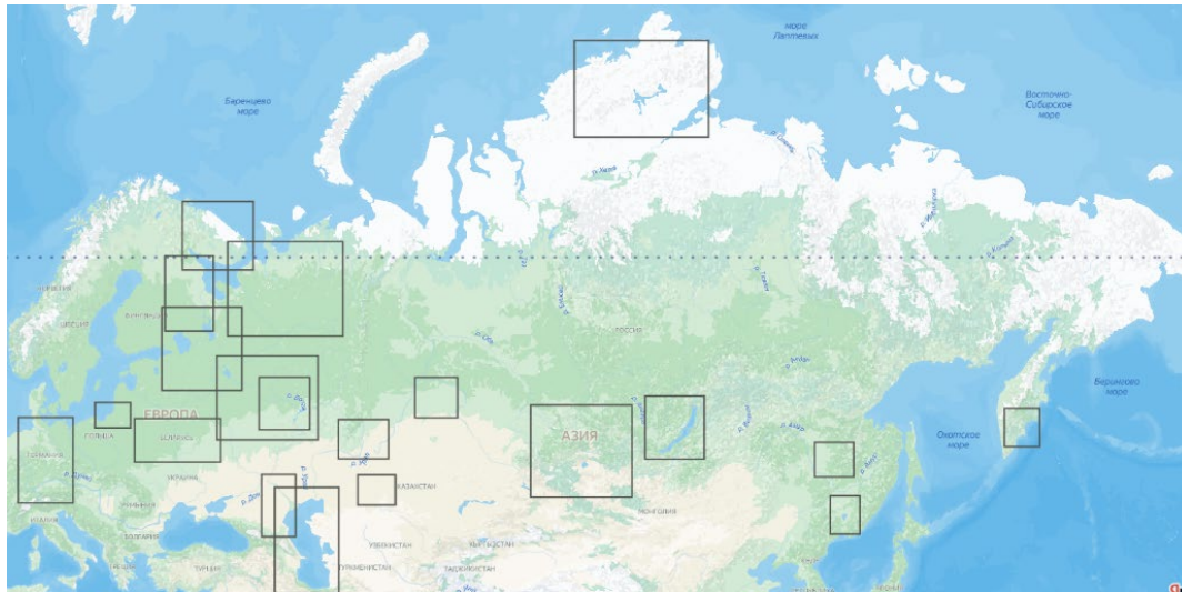
Рис.2. География исследований, представленных на конференции «Лимнология в России»

Конференция в основном проходила в очном режиме, несколько докладов было сделано дистанционно. Также была организована прямая трансляция всех заседаний. Заслушано 124 доклада (91 очный доклад, 9 дистанционных и 24 стендовых доклада). Общее число участников на заседаниях составило более 200 человек. В конференции приняли участие ученые из 48 научных организаций и университетов 18-ти городов России и двое коллег из Белорусского Университета.