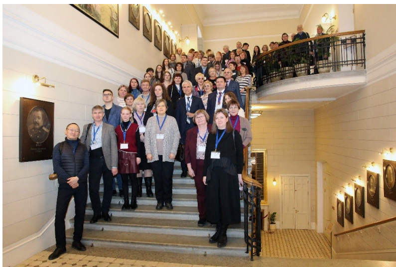
Fig.1. In the conference “Limnology in Russia”. Russian Geographical Society, St. Peterburg, 12.02.2024

The geography of the research presented at the conference covered a significant part of the Russia territory, as well as the Republic of Belarus and Germany (Fig. 2). The reports included to studies of both large (Ladoga, Onega, Baikal, Aral, Caspian Sea, Khanka, Kronotskoye) and small lakes (lakes of the North-West, North-East and center of the European part of Russia, the Kola Peninsula, Taimyr, Siberia, Central Asia). Among the large lakes, especially many research results of Lakes Ladoga and Onega were presented; presentations on them were made at all sessions of the conference. Interesting presentations were devoted to the island lakes of the Valaam and Solovetsky archipelagos and the Arctic islands. The