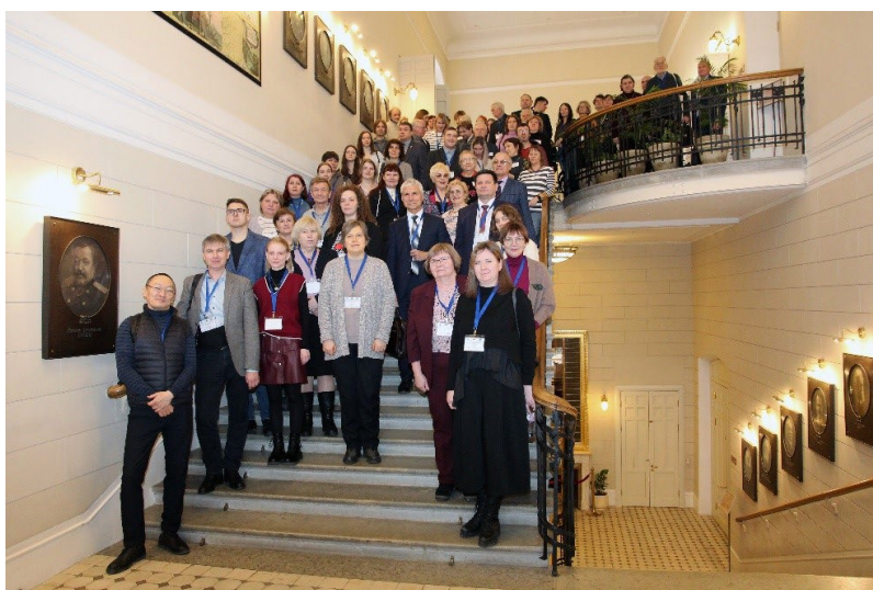
Рис.1. На конференции «Лимнология в России». Русское географическое общество, Санкт-Петербург, 12.02.2024

География представленных на конференции исследований охватывала значительную часть территории России, а также республики Беларусь и Германии (Рис. 2). Доклады были посвящены исследованиям как больших (Ладожское, Онежское, Байкал, Арал, Каспийское море, Ханка, Кроноцкое), так и малых озер (озера Северо-Запада, Северо-Востока и Центра Европейской части России, Кольского полуострова, Таймыра, Сибири, Центральной Азии). Среди больших озер особенно много было представлено результатов исследований по Ладожскому и Онежскому озерам, доклады по ним прозвучали на всех секциях конференции. Интересные доклады были посвящены островным озерам Валаамского, Соловецкого архипелагов и арктических островов. Обсуждались проблемы водохранилищ на примерах Рыбинского, Бурейского, Чебоксарского, Можайского и др.