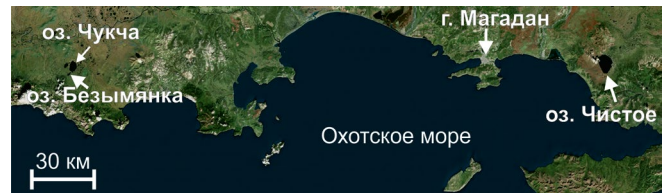
Рис.1. Расположение исследуемых объектов.

Содержание SiO_2 и ППП постепенно увеличивается снизу-вверх в колонке Чб 1, что