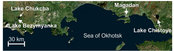
Fig.1. Location of the studied objects.

The content of \text{SiO}_2 and LOI gradually increases from the bottom up in the core Chb 1, which indicates